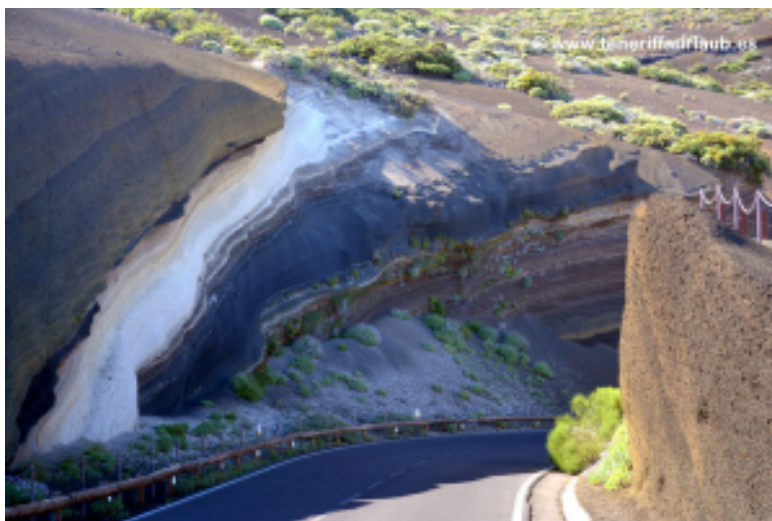
Mirador de la Tarta del Teide

El nombre viene precisamente de ese aspecto estratificado, como si alguien hubiera cortado una enorme tarta volcánica.