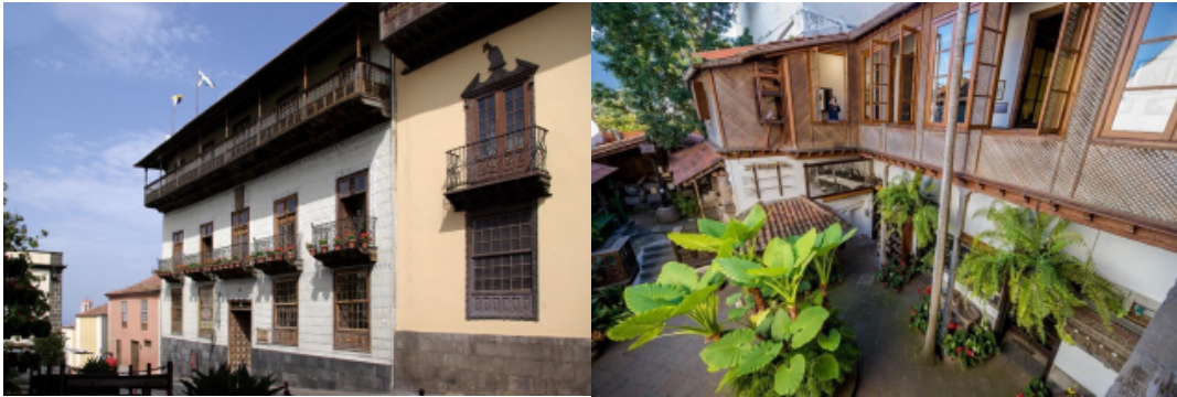
Exterior e Interior de la Casa de los Balcones en La Orotava

La Orotava no intenta impresionar con grandes monumentos. Lo hace con detalles: balcones de madera, calles empedradas y vistas al Teide que parecen irreales.