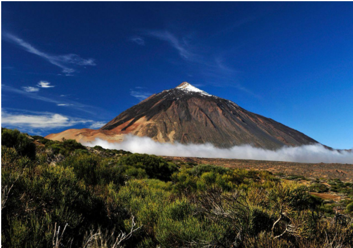
El Teide, techo de España