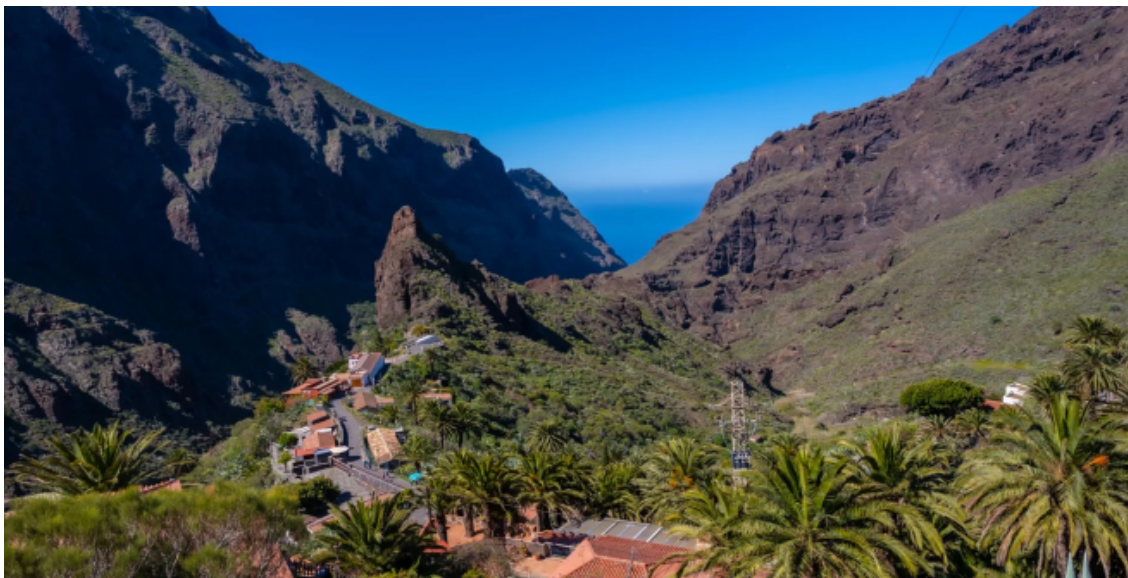
Masca, "El Machu Picchu español"

https://www.getyourguide.com/es-es/tenerife-l350/tenerife-excursion-por-encima-de-masca-en-el-bosque-encantado-con-recogida-t551804/?ranking_uuid=024e09d6-5be5-4ec6-9b0c-35f04229de8b