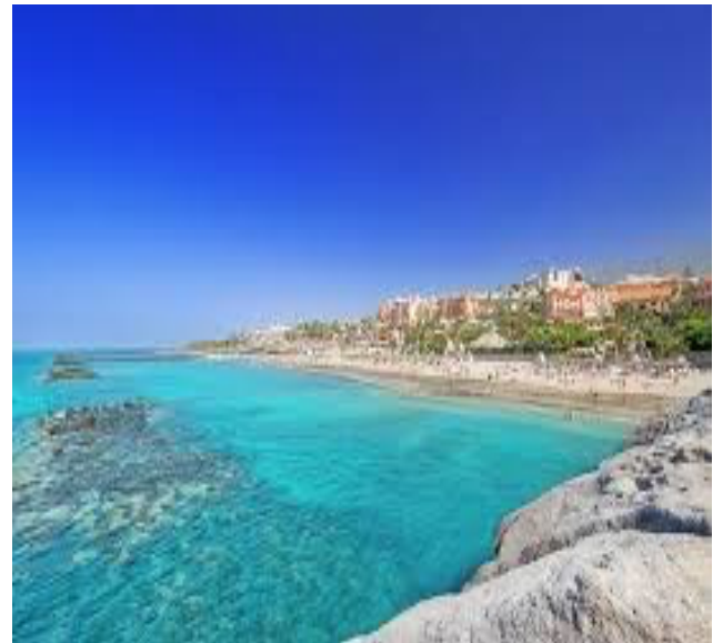
Playa del Duque