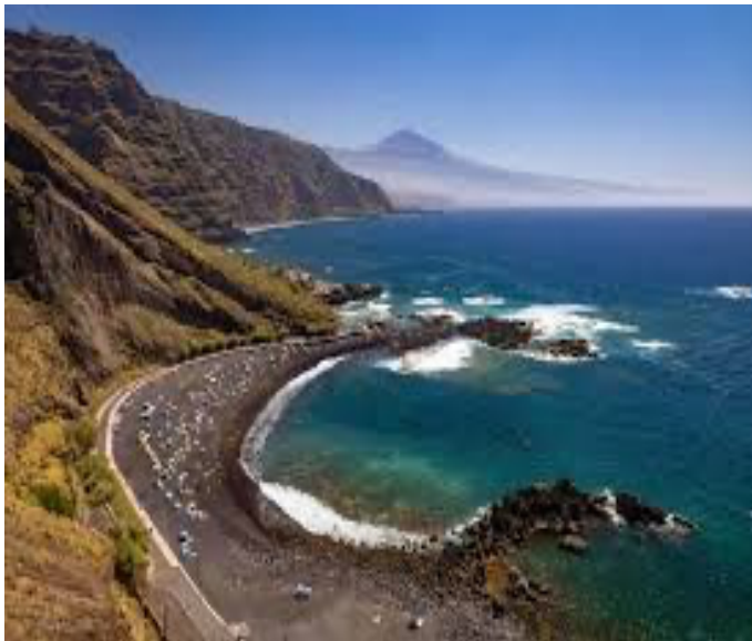
Playa de Mesa del Mar

Llevad escaarpines y gafas de snorkel. En la mayoría de las playas hay pececillos muy chulos e incluso viejas (el pez favorito de la isla, a la brasa o plancha, insuperable). Cuanto más alejados de la gente y pegados a las rocas, más peces veréis. ¡Cuidado con los erizos en los charcos!