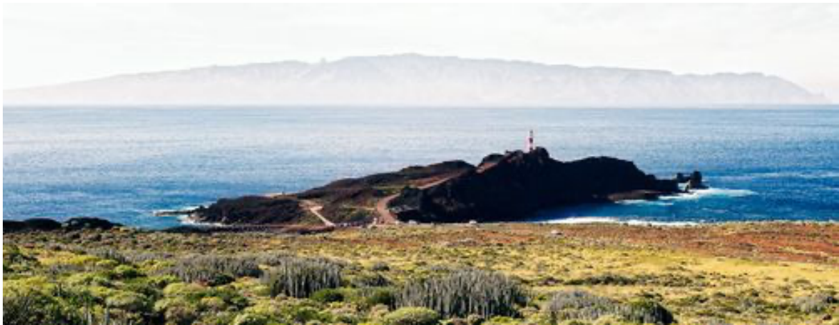
Punta de Teno con La Gomera de fondo

El extremo más occidental de la isla. Faro, vistas a los Acantilados de Los Gigantes desde otro ángulo, y la isla de La Gomera al fondo. El atardecer desde aquí es de los mejores de Tenerife y prácticamente del mundo 🤩 — lo recomendamos totalmente.