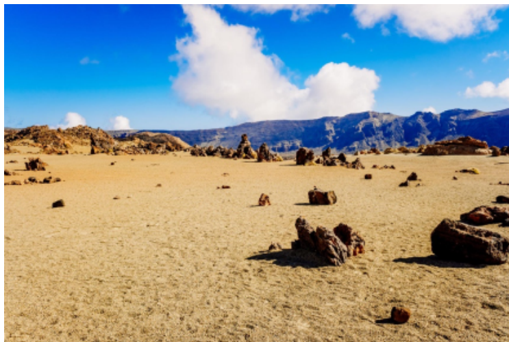
Minas de San José en la subida al Teide

Geológicamente, la mayor parte de esos materiales proceden de erupciones explosivas de Montaña Blanca , que expulsaron enormes cantidades de piedra pómez hace unos 2.000 años. Posteriormente, estos depósitos se acumularon en la zona y llegaron a explotarse comercialmente, de ahí el nombre de "Minas".