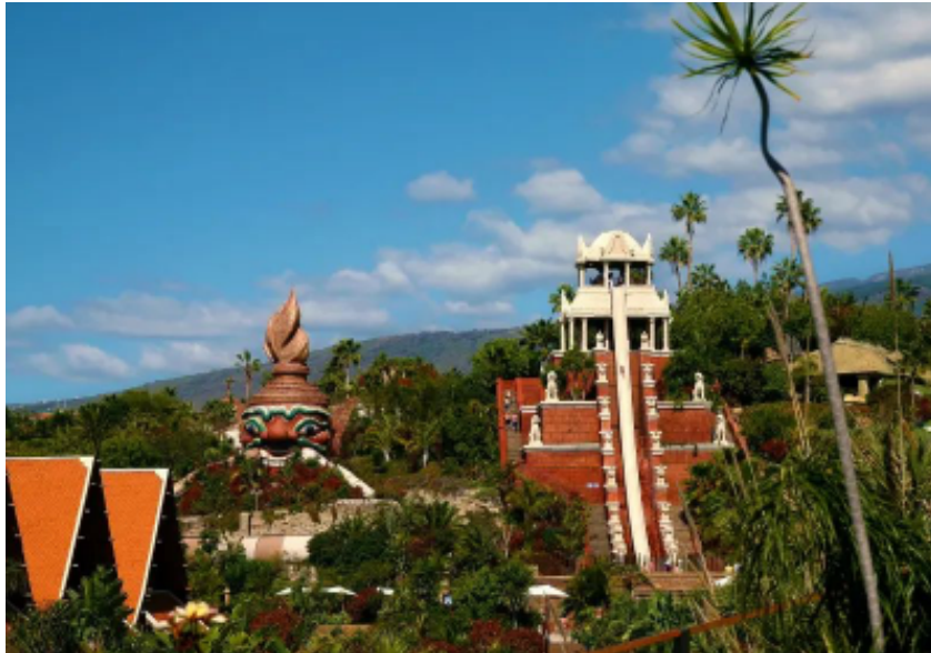
Tower of Power, atracción más famosa del Siam Park