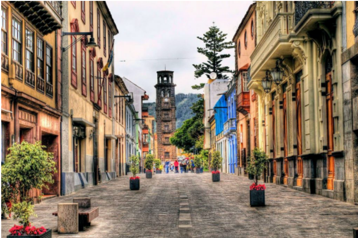
La Laguna, Patrimonio de la Humanidad