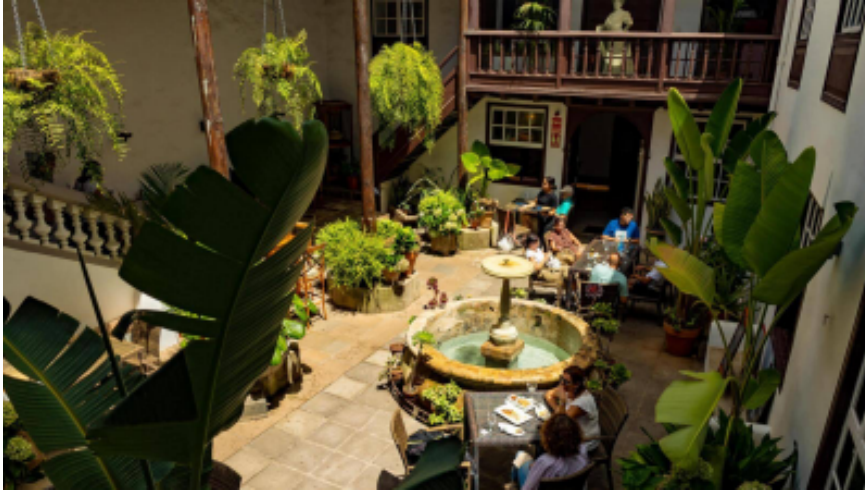
Casa Museo Cayetano Gómez Felipe

Pasear por las calles de La Laguna al atardecer tiene un encanto especial. Recomendamos dejar la visita para por la tarde y cenar allí. Ojo: coged una chaquetita.