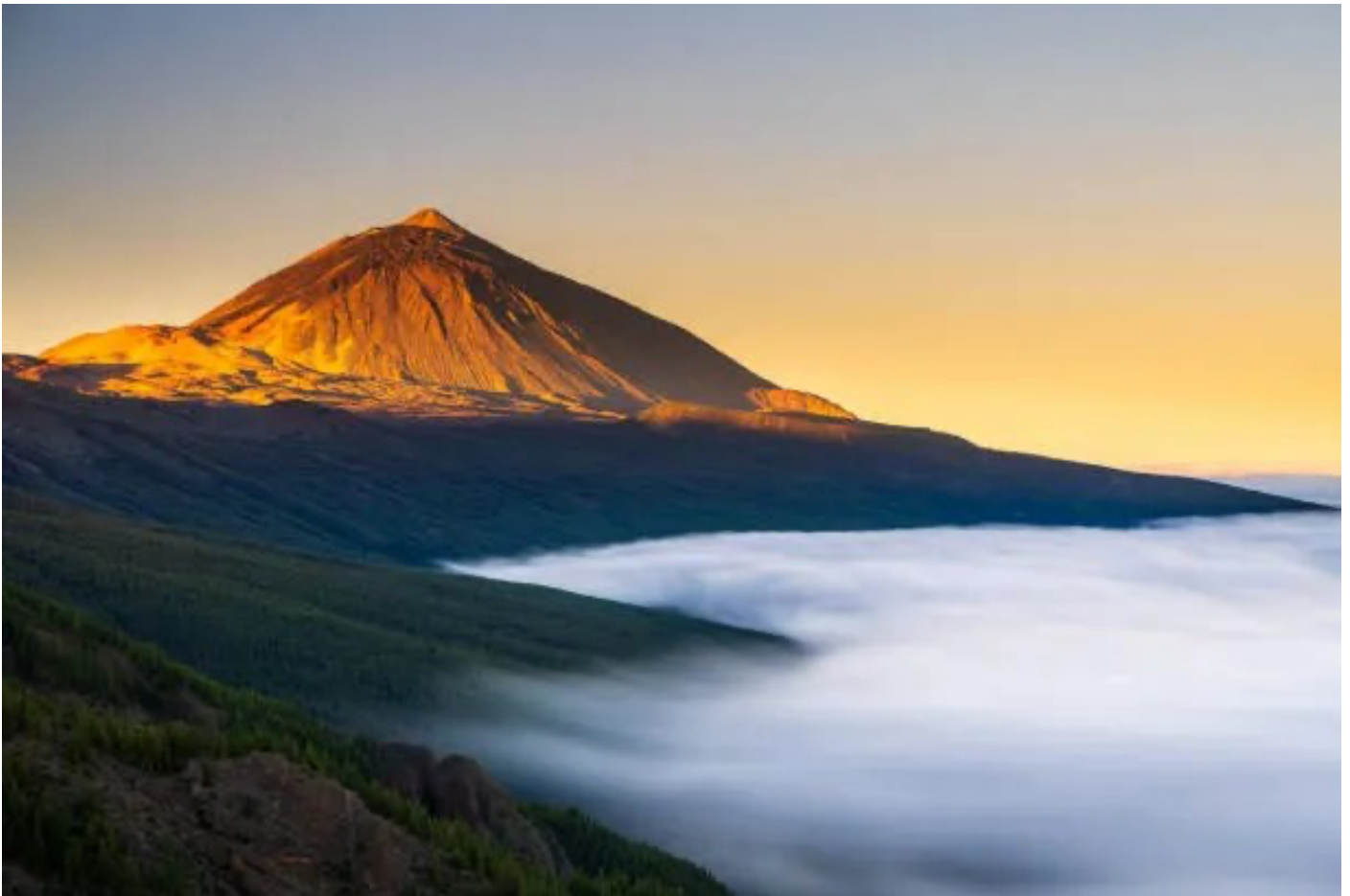
Vista del Teide junto con el mar de nubes