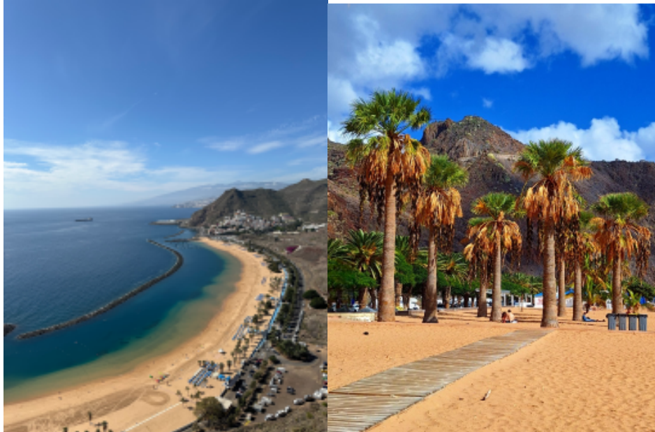
Playa de las Teresitas con el espigón a la izquierda

Playa artificial en Santa Cruz con arena amarilla traída del Sáhara, y con ella, al principio, algunos inquilinos no invitados cuando se construyó (escorpiones, pero tranquilos, ya no hay). Muy tranquila, con chiringuitos y aparcamiento a pie de playa. Se puede nadar hasta el espigón y, con suerte, veréis algún tiburón angelote descansando en el fondo, se camuflan muy bien y no hacen absolutamente nada.