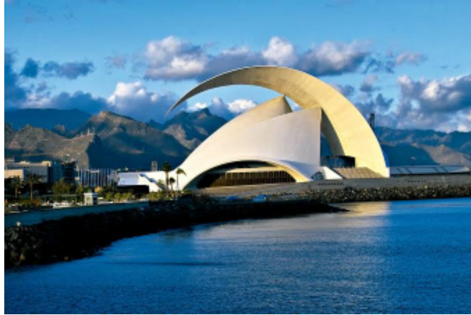
Auditorio de Tenerife