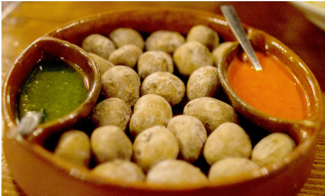
La gastronomía canaria, una experiencia única

Comer bien en Tenerife es fácil. Comer muy bien, también — si sabéis dónde ir. Y para eso estamos nosotros.