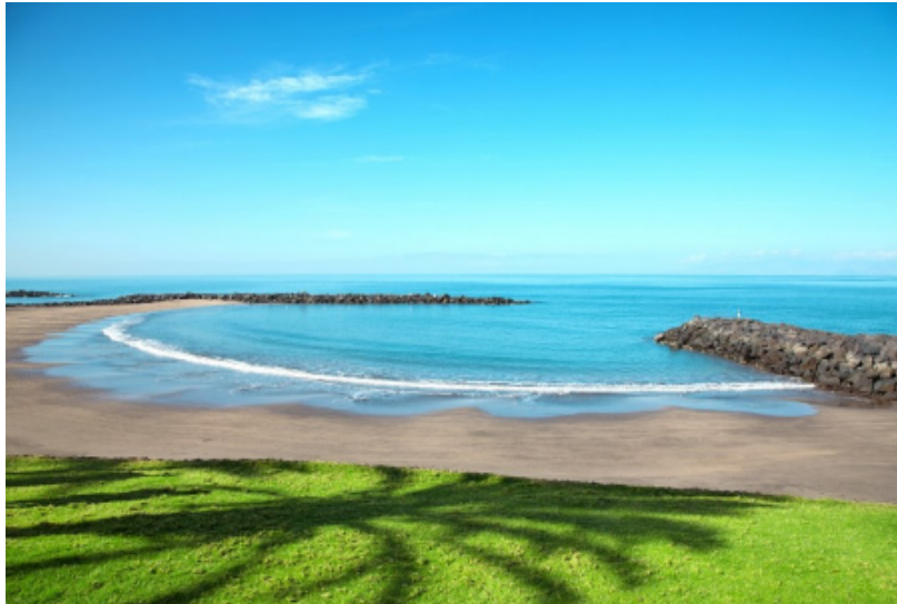
La costa de Tenerife, paraíso para el buceo y el avistamiento de cetáceos