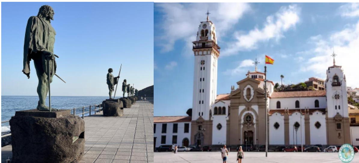
Estatuas y plaza de los Menceyes