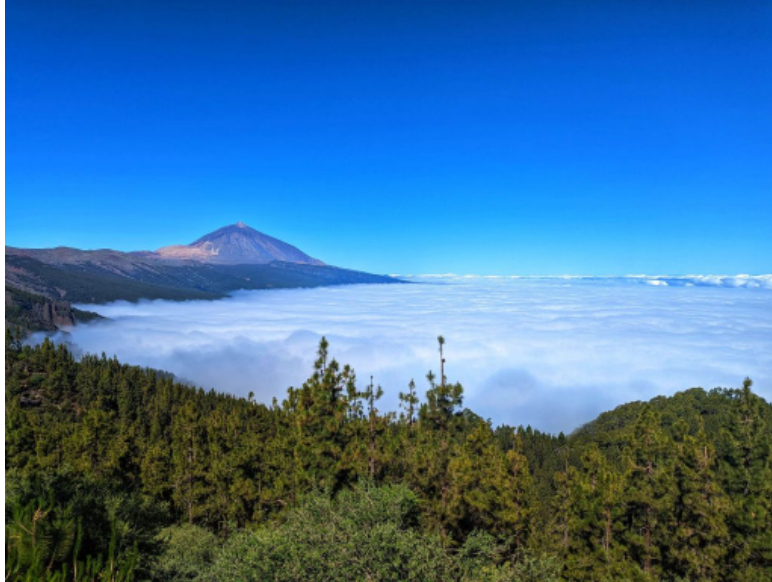
Mirador de Chipeque, junto al mar de nubes

Miradores obligatorios: Mirador de Ayosa y Mirador de Chipeque.