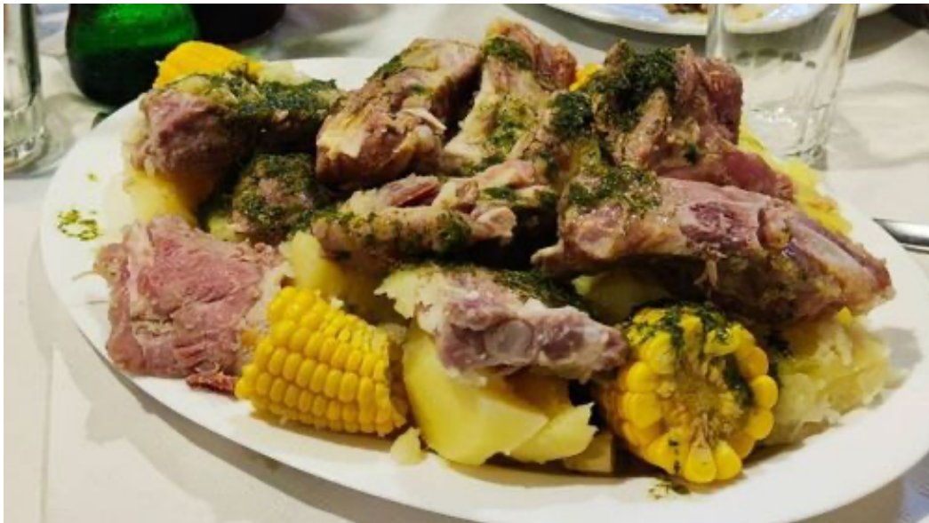
Papas piñas y costillas en Casa Tomás

El Portezuelo · cerca del aeropuerto Norte. Las famosas papas piñas (mazorcas de maíz) y costillas. BUENÍSIMO. No se reserva: llegas, coges número y vas pasando, va rápido. Solo comida, no se os ocurra cenarlo. 😂