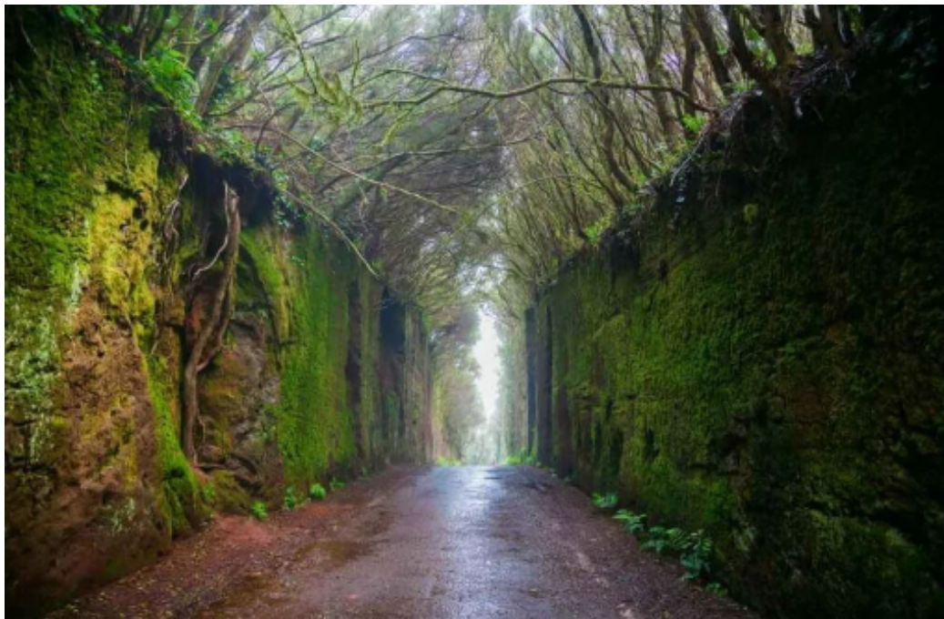
Famosa foto del Pico del Inglés, en el parque rural de Anaga

Miradores de la zona: Jardina, Cruz del Carmen, Pico del Inglés. Este último es el más famoso por las dos paredes verdes, conforme vas al mirador, sale una carretera a la izquierda donde todo el mundo tiene su foto.