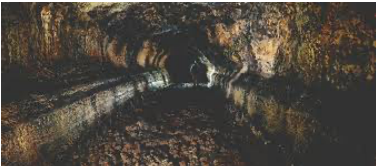
Vista interior del tubo volcánico