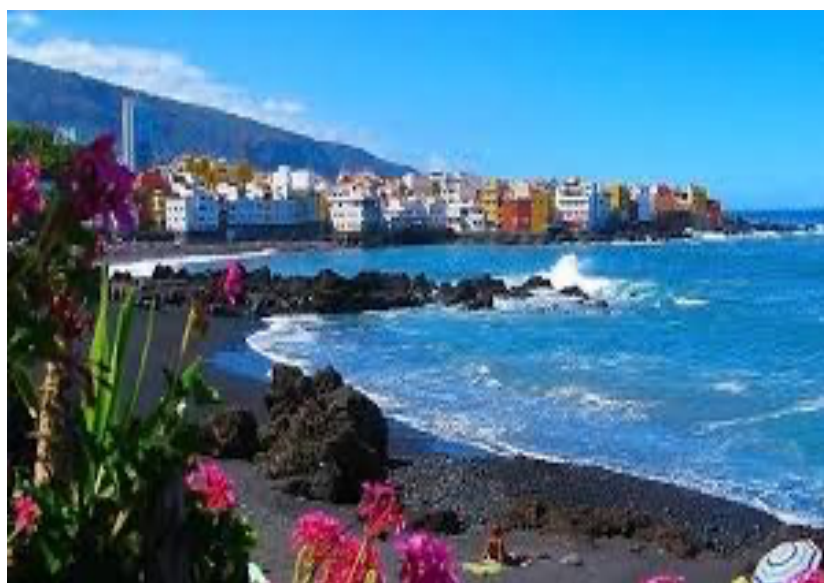
Playa Jardín en el Puerto de la Cruz

La opción del norte para cuando las ganas de bañarse no dan espera. Sin ser especialmente bonita, cumple perfectamente si salís del Loro Parque y os apetece un chapuzón rápido.