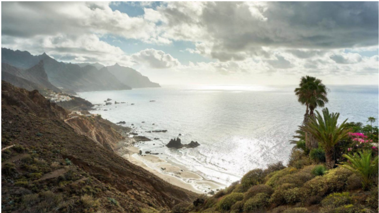
Playa de Benijo

Actualmente el acceso se encuentra cerrado por desprendimiento de la escalera. Podéis dejar el coche y hacer la ruta del Draguillo (1,9 km), un paseo muy bonito igualmente y se ve la playa desde arriba.