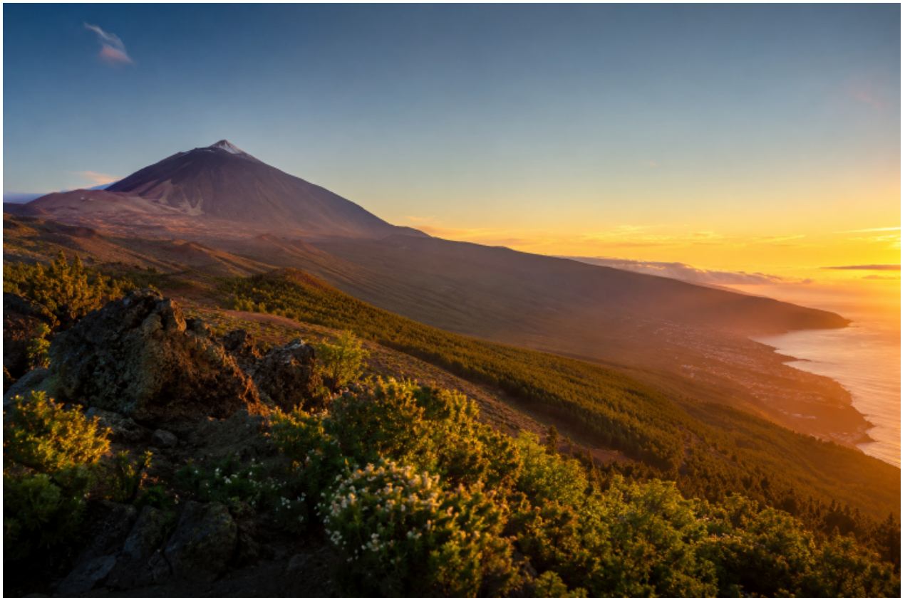
Tenerife os espera