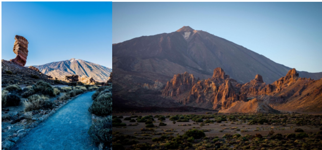
Roque Cinchado y Roques de García. Vista desde el Llano de Ucanca

Curiosidad ✨: El Roque Cinchado es famoso además porque aparecía en los billetes de 1.000 pesetas y durante años fue imagen de Canarias.