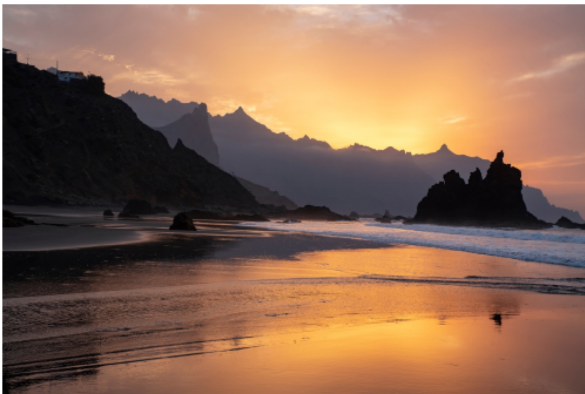
Vistas desde las playas del norte, playa de Benijo.