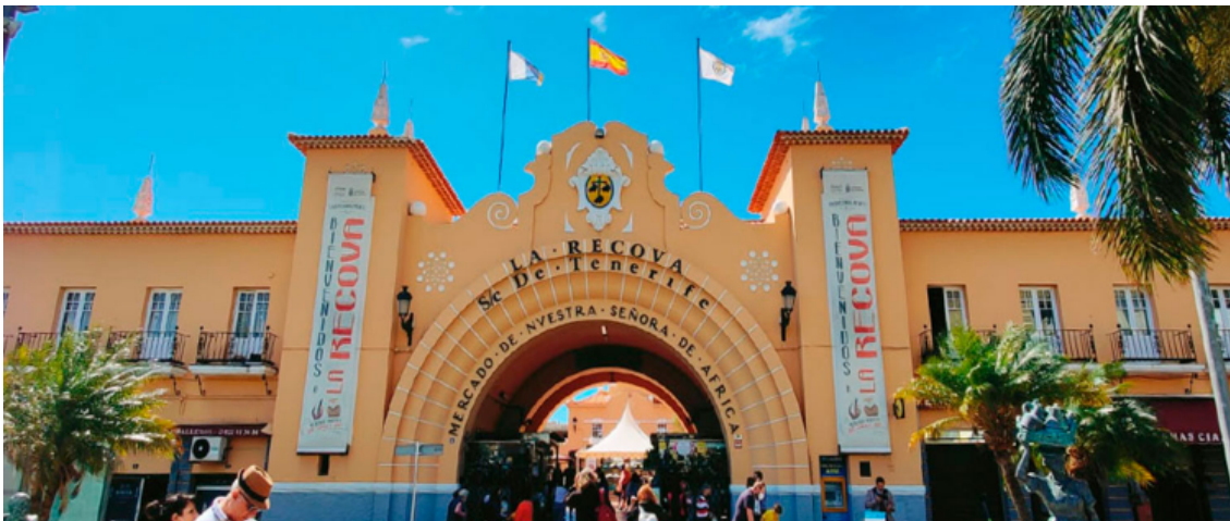
Mercado Nuestra Señora de África. Sta Cruz de Tenerife