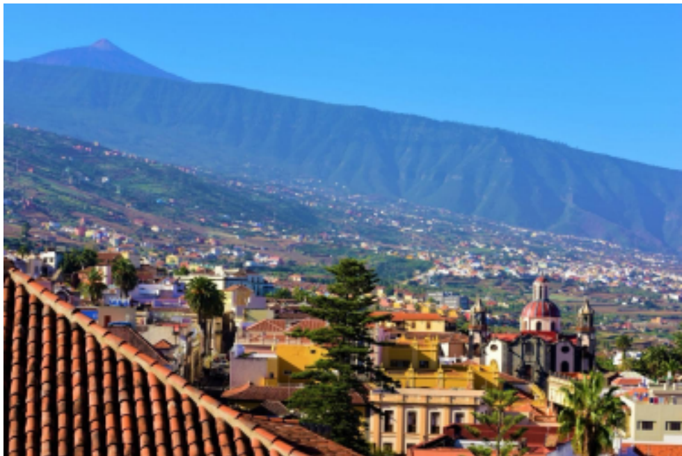
Vistas del Valle de La Orotava con El Teide de fondo

Y probablemente por eso termina siendo uno de los lugares más especiales de toda la isla.