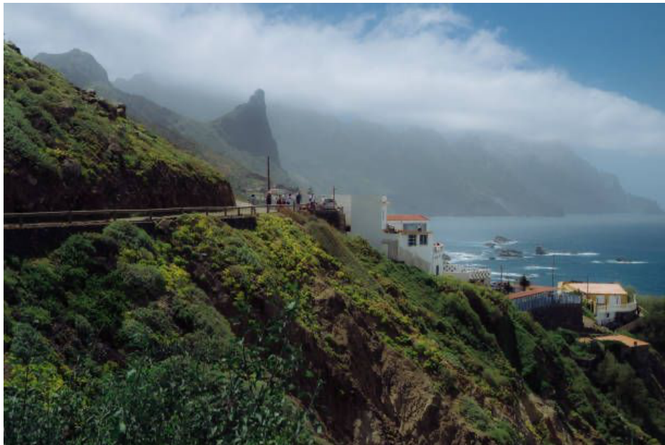
El norte de Tenerife, verde y auténtico

Zonas como San Cristóbal de La Laguna y el Puerto de la Cruz ofrecen hoteles con encanto, apartamentos y una base perfecta para explorar la isla con calma. Gastronomía local, rutas a Anaga y al norte más tradicional, todo al alcance de la mano.