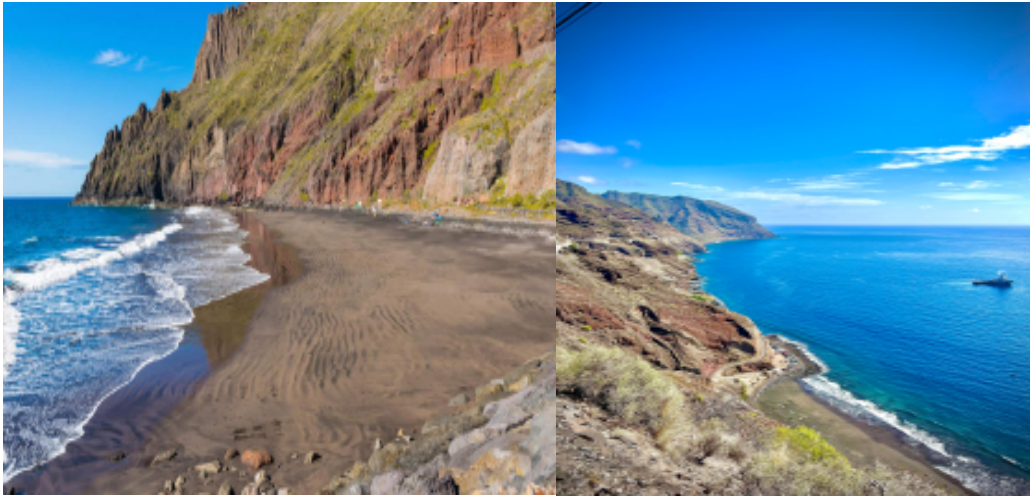
Playa de las Gaviotas desde la playa y vista desde el mirador.