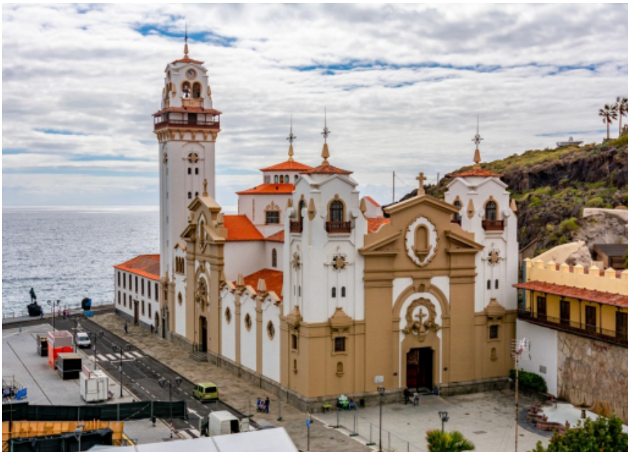
Basilica de Nuestra Señora de la Candelaria

Paseo de Caletillas para estirar las piernas junto al mar.